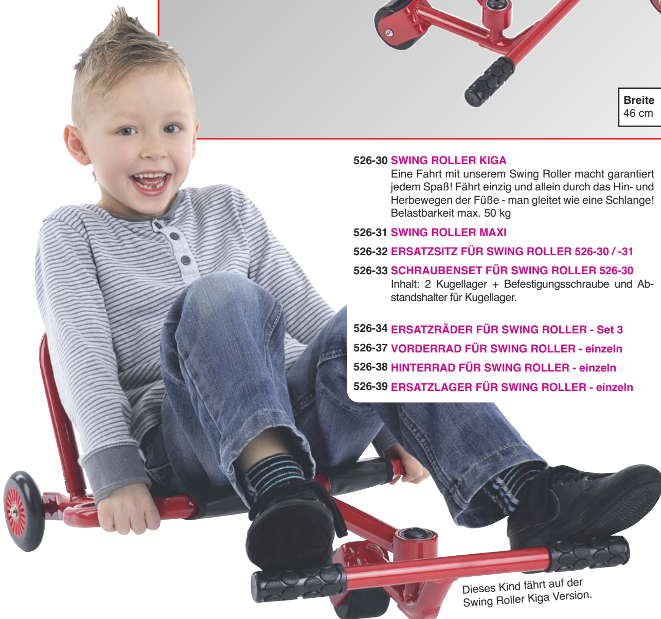
Dieses Kind fährt auf der Swing Roller Kiga Version.