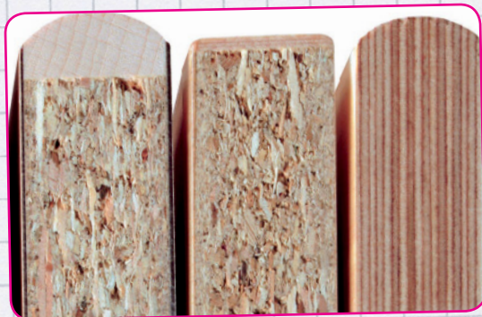
HPL-Platte mit Massi-