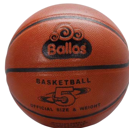
664-05 MERLIN PRO BASKETBALL - No. 5 Perfekter Jugend- und Trainingsball. langlebig, griffig und sehr form- und druckstabil. Indoorball. ø 22 cm, Gewicht 470 g, Material Material Micro Fibre.