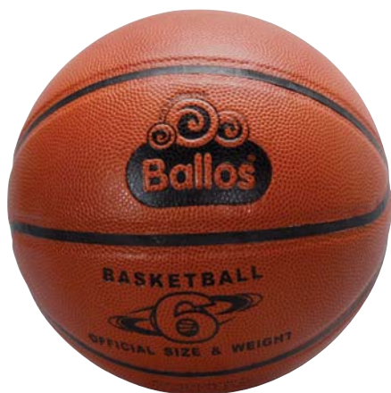
664-06 MERLIN PRO BASKETBALL - No. 6 Äußerst beliebter Ball bei Schulen, die auf Basketball mehr Wert legen. Auch für den Vereinssport sehr gut geeignet. Indoorball. ø 23 cm, Gewicht 513 g, Material Micro Fibre.