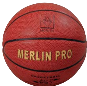
664-03 MERLIN PRO BASKETBALL - No. 3 Ein kleiner Jugendball für den Schulsport. Indoorball. ø 14 cm, Gewicht 202 g, Material Micro Fibre.