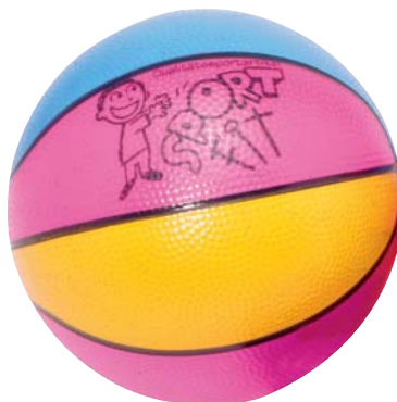
661-03 ECO BASKETBALL - 20 cm Perfekter Trainingsball aus Gummikarkasse. Sehr langlebig und form- und druckstabil. Griffige Oberflächenstruktur. Indoor- und Outdoorgeeignet. Ø 20 cm.